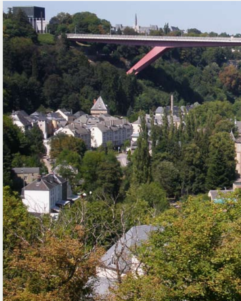
Von Luxemburg-Pfaffenthal ging ein Teil der musikalischen Entwicklung des Großherzogtums aus.